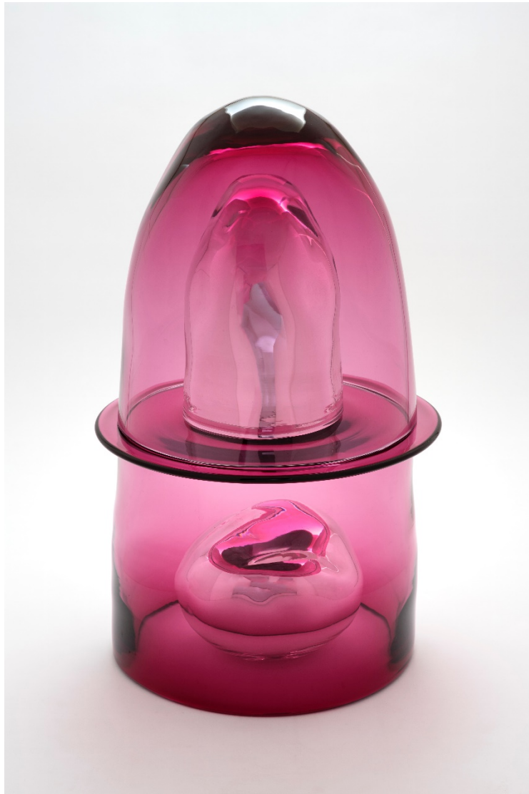
Tristano di Robilant La Sibilla , 2024 Verre soufflé - cm 58 x 35 x 35

L'exposition comprendra une grande pièce murale en céramique, composée de différents panneaux de céramique peints et cuits à Ripabianca, en Ombrie. Les pièces en verre sont toutes soufflées à la main à Murano avec la collaboration du maestro Andrea Zilio et le maestro Andrea Salvagno. Sont également exposés un groupe de monotypes réalisés pour cette occasion avec l'aide de la Stamperia d'Arte Berardinelli à Vérone.