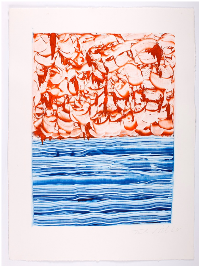
Tristano di Robilant Untitled , 2024 Monotype - cm 75 x 54

Ses expositions collectives incluent le Museo del Vetro, Murano, Musée Maxxi, Rome et Galleria dell'Accademia, Venise en 2024.