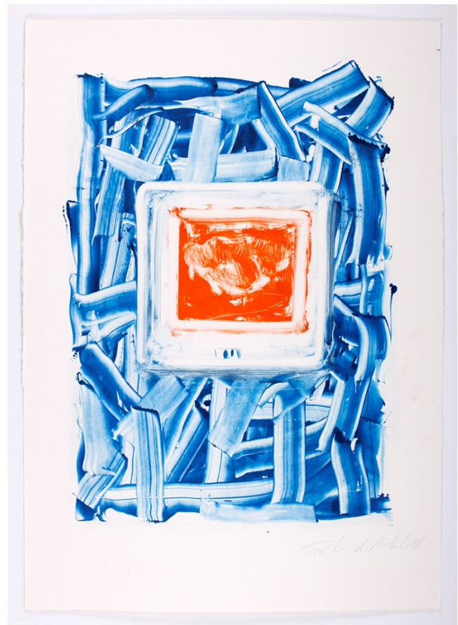
Tristano di Robilant Untitled , 2024 Monotype - cm 75 x 54